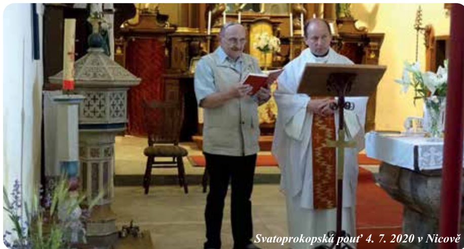
Svatoprokopská pouť 4. 7. 2020 v Nicově

Druhá velká pouť je ta naše zdíkovská. Poutě ve Zdíkově jsou také konané po mnoho let. I tam jsem se svou babičkou chodila a těšila se na ni. Tady již býval kolotoč a více stánků. Na oběd jsme chodili k mé tetě. Ta nás pohostila a my