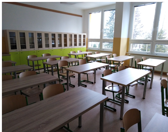
FOTO UČEBNY PŘÍRODOPISU