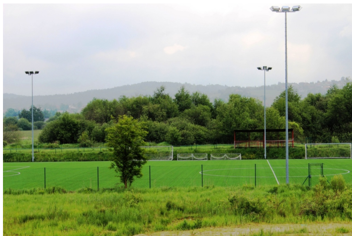
Obr. 3 - Dnešní podoba "Hochgerichtu" - pahorek za hřištěm