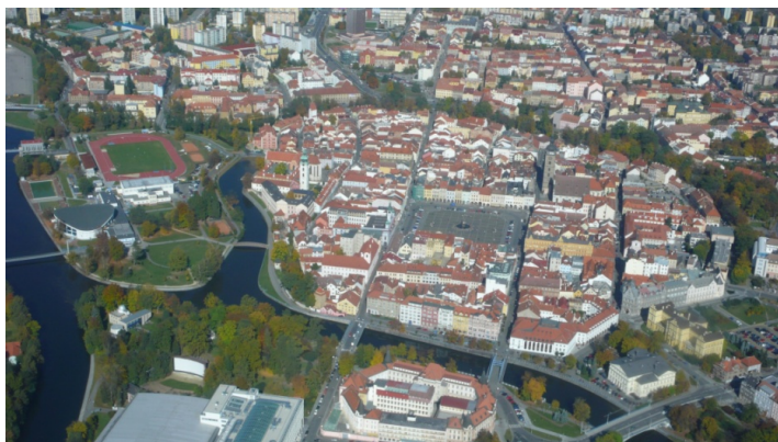
Obr. 1 - Centrum Českých Budějovic

České Budějovice jsou krajským městem nejkrásnější části České republiky - Jihočeského kraje. Jejich historie začíná roku 1265, kdy si místo na soutoku řek Vltavy a Lužnice zvolil český král Přemysl Otakar II. k vybudování základny svého mocenského postavení v jižních Čechách. Obdélníkové náměstí o ploše jednoho hektaru a pravidelný půdorys založeného města jsou znakem vyspělého urbanismu té doby. Díky výhodné strategické i hospodářské poloze a díky